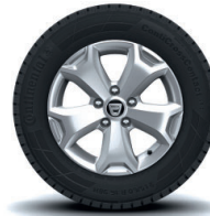
16" kevytmetallivanteet Cyclade