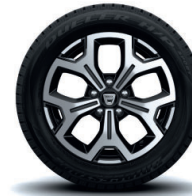
17" kevytmetallivanteet Maldiva mustalla värikoodauksella