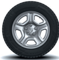
16" Design-teräsvanteet Fidji